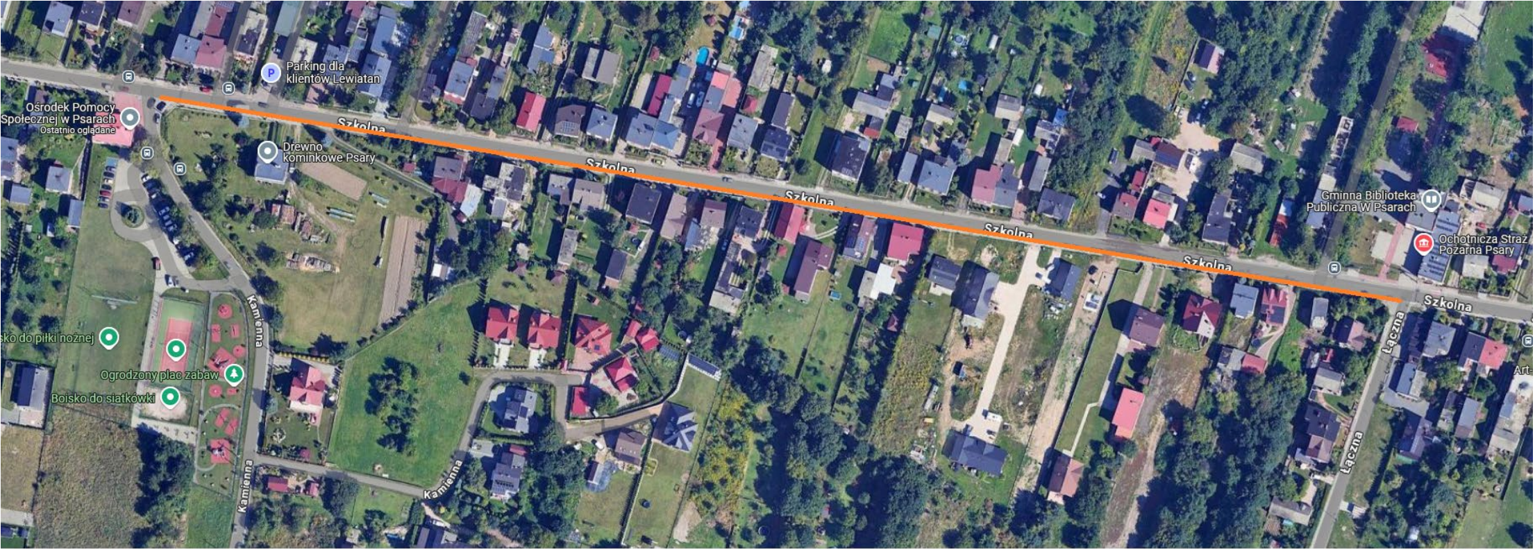
Zakres opracowania wykonania nowej nawierzchni chodnika wraz ze zjazdami w ul. Szkolnej w Psarach. Odcinek od Ochotniczej Straży Pożarnej do skrzyżowania ul. Szkolnej z ul. Kamienną.